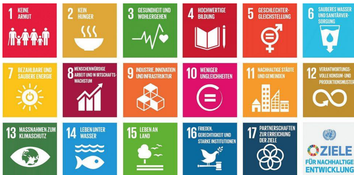
Abb. 1 – Die 17 Ziele für nachhaltige Entwicklung bilden den Kern der Agenda 2030.

Empfehlung: Der Bundesrat soll eine über den fachlich-sektoral ausgerichteten Bundesämtern angesiedelte Organisationseinheit schaffen, welche die Handlungsfähigkeit der Akteure auf allen institutionellen Ebenen stärkt, und eine kohärente Umsetzung der Agenda 2030 in und durch die Schweiz sicherstellt. Diese Organisationseinheit ist mit den notwendigen Ressourcen zu versehen, damit sie als zentrale Anlaufstelle für die Wirtschaft, Zivilgesellschaft, Wissenschaft und Kantone und Gemeinden agieren kann. Eine solche Organisationseinheit kann sein: Bundeskanzlei (mit entsprechendem Ausbau der Kompetenzen), unabhängiges Büro oder eine direkt vom Bundesrat delegierte Person mit weitreichenden Befugnissen. 4