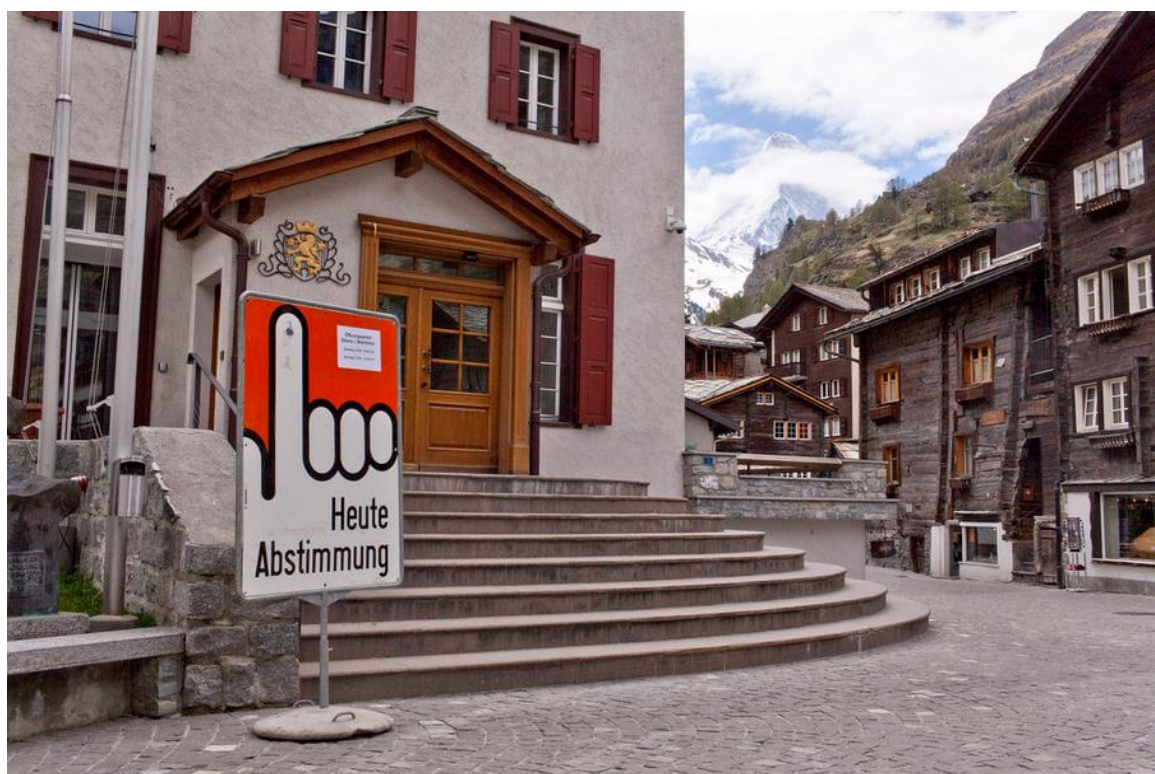
Abb. 4 – Ein Schild vor dem Gemeindehaus in Zermatt weist auf die Volksabstimmung vom 17. Mai 2014 hin.

Empfehlungen: Der Bundesrat soll die Anstrengungen intensivieren, um die Agenda 2030 in der Bevölkerung bekannter zu machen, und die Chancen, welche eine zukunftsorientierte Nachhaltigkeitspolitik für die Schweiz erbringt, aufzeigen. Konkret könnten folgende Massnahmen ergriffen werden: Nationaler Tag zur Agenda 2030, breit angelegte Kommunikationskampagne, breite BürgerInnenbefragung, z.B. zu den Prioritäten für die nächste Strategie Nachhaltige Entwicklung 2020-2023. Auch soll der Bundesrat das Parlament regelmässig einbeziehen und über den Stand der Umsetzung berichten.